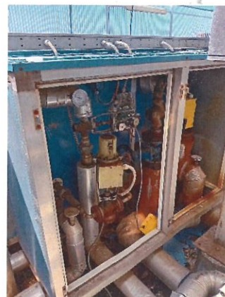
Figura 4.1.2 Dettaglio