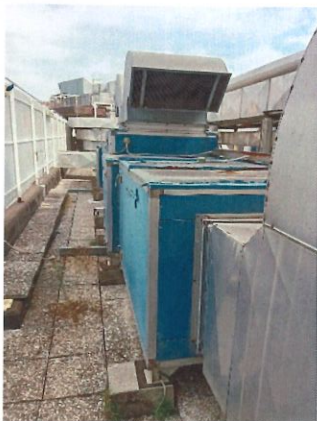
Figura 4.1.1 UTA sterilizzazione

L'UTA di marca GERINI mod.GR 13 del 2000 è dedicata al reparto di sterilizzazione piano - 1. La macchina, di portata d'aria pari a 8.300 mc/h, risulta vetusta e si presenta in condizioni di vetustà. Sono presenti due batterie rispettivamente di riscaldamento e raffreddamento in condizioni appena sufficienti di conservazione. All'interno della macchina sono presenti i ventilatori di mandata e di ripresa con motori a cinghia ed uno scambiatore di calore a flussi incrociati. I filtri assoluti sono presenti sugli anemostati presenti nel locale.